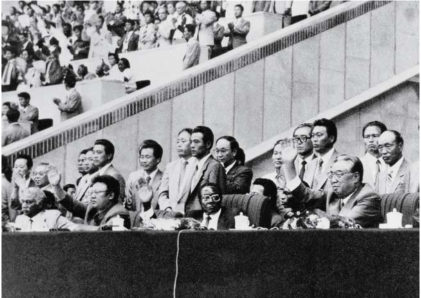
Kim Jong Il nimmt mit dem Präsidenten Kim Il Sung an der Eröffnungsfeier der XIII. Weltfestspiele der Jugend und Studenten teil. (1. Juli 1989)