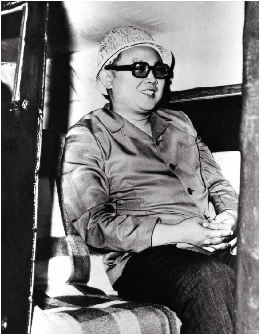
Bei der Vor-Ort-Anleitung im Erzbergwerk Komdok (1. Juli 1975)