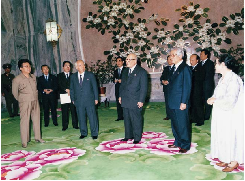
Beim Gespräch mit Funktionären des Chongryon (29. Dezember 1986)