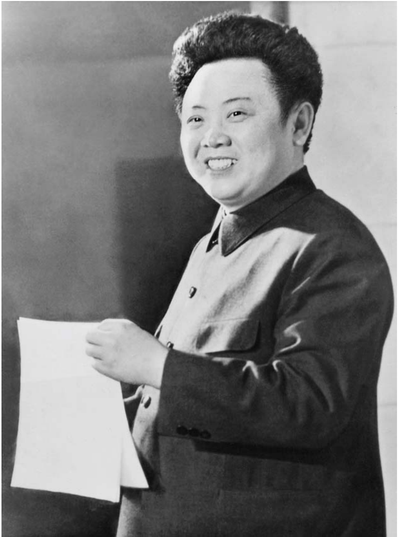
Kim Jong Il sieht sich ein Dokument über die Parteiarbeit an.