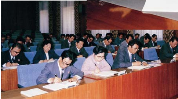
Auf einer Sitzung des Sekretariats beim ZK der PdAK (22. Mai 1985)