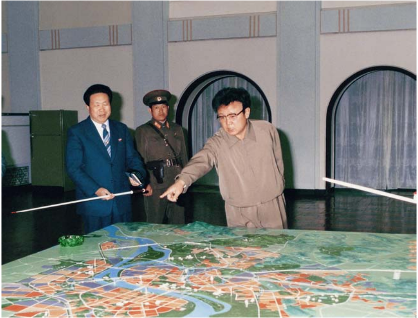
Bei der Begutachtung eines Modells für die Gestaltung der Stadt Pyongyang (30. März 1985)