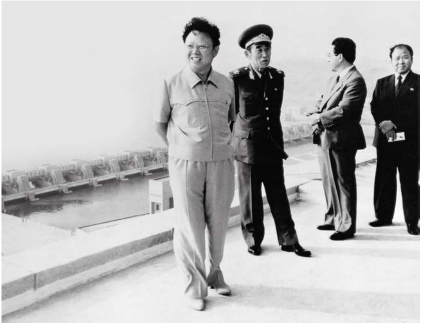
Bei der Vor-Ort-Anleitung am Westmeerschleusenkomplex (23. Juni 1986)