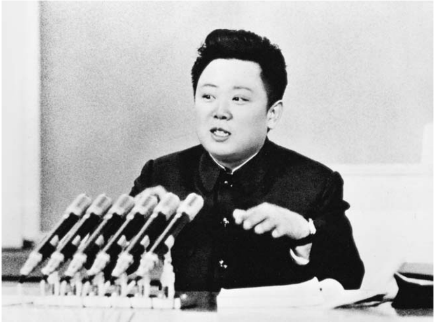
Kim Jong Il hält die Schlussansprache auf dem landesweiten Lehrgang der Parteipropagandisten. (19. Februar 1974)