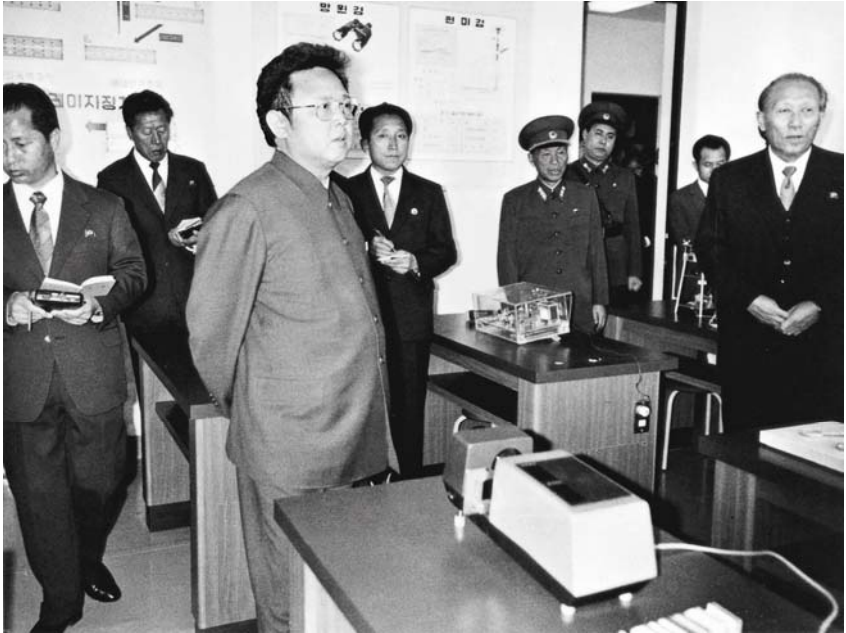
Bei der Vor-Ort-Anleitung an der Pyongyanger 1. Oberschule (26. Februar 1985)