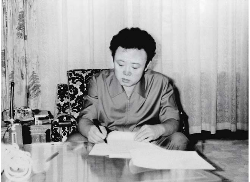
Bei der Verfassung einer Abhandlung